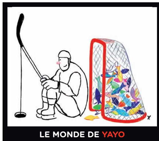
LE MONDE DE YAYO

Des résidus de bois peuvent se retrouver dans des objets inusités, révèle l'ouvrage American Canopy: Trees, Forest, and the Making of a Nation , d'Eric Rutkow. Des exemples ? Le fromage râpé vendu en sachets (auquel on ajoute de la cellulose en poudre — un des principaux composants du bois — pour en retarder le processus de moisissure) ; la bière en canette (la gomme de cellulose rend la mousse plus onctueuse) ; la crème glacée réduite en matières grasses (qui contient parfois de la pulpe de bois purifiée pour en améliorer la texture) ; les couches jetables (constituées en partie de pulpe de bois).